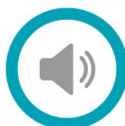
Grabaciones de voz