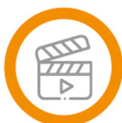
Videos de fuentes educativas