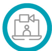
Videos de docentes