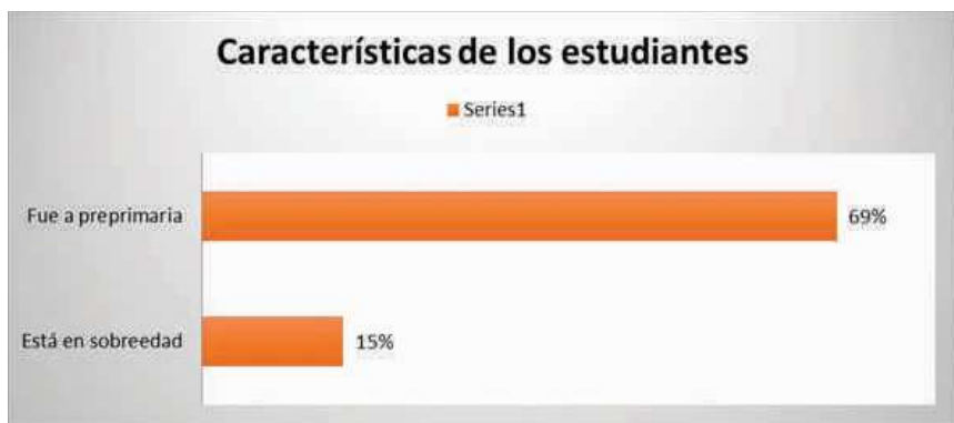
Gráfica 5. Características de educación de los estudiantes