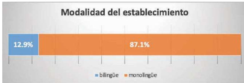
Gráfica 1. Modalidad del Establecimiento