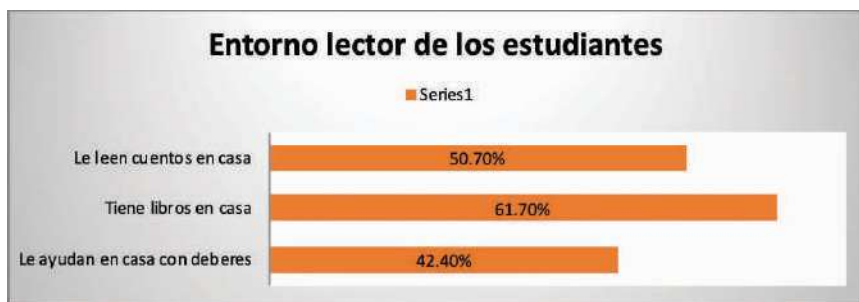
Gráfica 4. Entorno lector de los estudiantes

Nota: fuente elaboración propia a partir de la base de datos: Tesoro de la Lectura