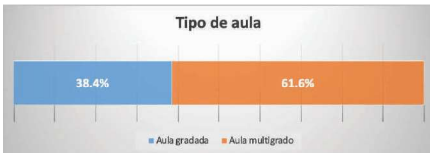
Gráfica 2. Tipo de Aula