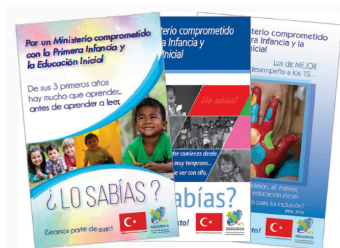
La CECC como parte del proyecto: "Hacia el acceso universal a la educación inicial y al nivel preescolar para la inclusión, equidad y permanencia en la educación general básica de Centroamérica y República Dominicana."

para identificar los aspectos que favorecen o desfavorecen este aprendizaje en la etapa escolar.