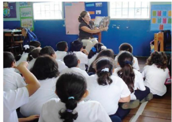
¿Cómo se estimula a nivel universitario la identidad lectora de las y los futuros docentes en Costa Rica?

Costa Rica es el país latinoamericano que más invierte en educación con un 7.6% PIB (Barquero. 2017). No obstante dicha inversión no parece reflejarse en el desempeño de sus estudiantes. (Cerdas. 2017). Los resultados del Programa Internacional para la Evaluación de Estudiantes (PISA) evidencian retrocesos en el pro-medio de la comprensión lectora de casi 10 puntos para los estudiantes costarricenses de 2012 a 2015 (Chacón. 2016). Por otro lado, el resultado de Costa Rica en las pruebas de Lectura del Estudio TERCE 2015 evidencia que la mayoría de estudiantes (45%) muestra