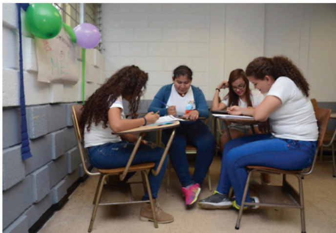
Es Inminente promover que los programas universitarios docentes en Costa Rica sean espacios de estímulo a la identidad lectora de las y los futuros docentes.

Roya Scales et al. (2018) investigaron la formación de futuros docentes en un estudio de caso longitudinal que determinó que el desarrollo del criterio profesional para la enseñanza de la lectoescritura no era resultado exclusivo del contenido instrumental recibido en la formación universitaria sino también de las experiencias extra aula en este período (Figura 2). Además, dicho criterio no se limita sólo al conocimiento técnico en contenidos, destrezas y estrategias de lectoescritura sino que implica también una visión amplia de los requerimientos curriculares en perspectiva de la cultura escolar y comunitaria, así como de las necesidades de las y los estudiantes.