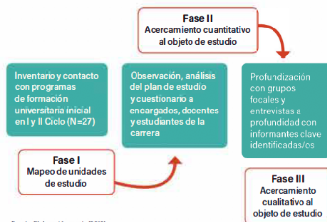
Figura 3. Metodología planteada para el estudio propuesto